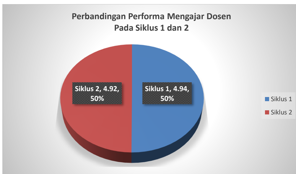
Gambar 3. Perbandingan Performa Mengajar Dosen pada Siklus 1 dan Siklus 2

Berdasarkan nilai rata-rata performa mengajar dosen pada siklus 1 dan siklus 2, bila ditunjukkan dengan grafik, tampak pada Gambar 3.